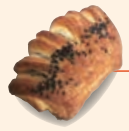
スイートポテト デニッシュ ¥150